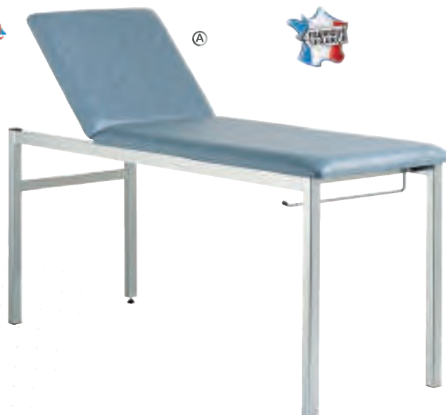
Table de massage 2 plans pliante

Tête avec trou pour le visage. Sac de transport à roulettes. Sellerie vinyle anti-feu, épaisseur 5 cm. Coloris noir, beige, chocolat ou bleu foncé. Châssis bois de hêtre. Dim. L 196 x l 70 x H 63-88 cm. Poids table : 17 kg. Poids max. : 200 kg. Garantie : 1 an.